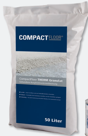
CompactFloor THERM PU 50 Liter (Granulat + Binder) Art.-Nr. 2 02 710